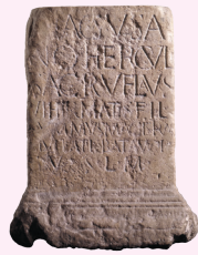
ALTAAR VAN MAGUSANUS HERCULES Sint-Michielsgestel, 1-69 n.Chr.