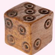
DOBBELSTEEN Amsterdam, 1200-1500