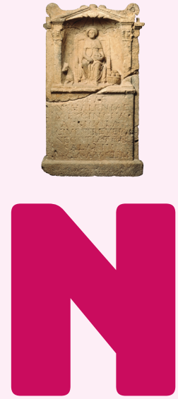
NEALENNIA ALTAAR Colijnsplaat, 150-250 n.Chr.