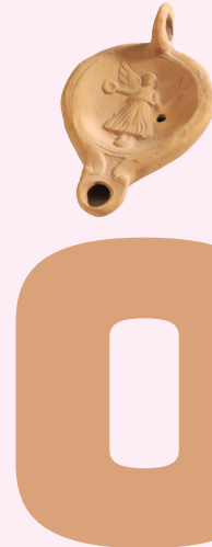
OLIEELAMP VAN NIJMEEGS-HOLDEURNS AARDEWERK Berg en Dal, 70-105 n.Chr.