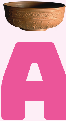
AARDEWERK TERRA SIGILLATA Utrecht, 14-37 n.Chr.