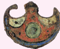
EMAILFIBULA Voorburg, 150-270 n.Chr.