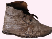
LEREN KINDERSCHOENEN Delft, 1400-1500