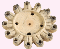
OLIEELAMP MET 13 TUITEN Nijmegen, 1-300 n.Chr.