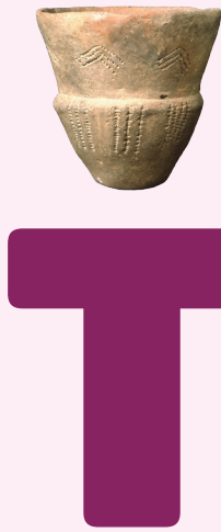
TRECHTERBEKER Borger, 3400-2900 v.Chr.