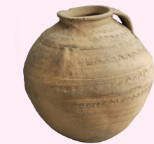
AMFOOR MET OREN Rhenen, 650-700 n.Chr.