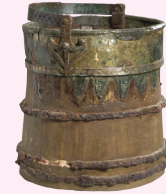
EMMER VAN HOUT MET VERSTERD BRONSBSLAG Rhenen, 550-600 n.Chr.