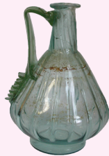
KANNETJE Cuijk, 69-96 n.Chr.