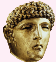
ROMEINS RUITERMASKER Leiden, 80-125 n.Chr.