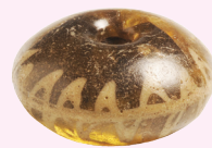
GLAZEN KRAAL MET WITTE ZIGZAGVERSIERING Rhenen, 470-515 n.Chr.