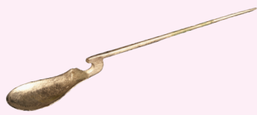
LEPEL Nijmegen, 1-300 n.Chr.