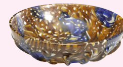
RIBKOM VAN MILLEFIORI-GLAS Nijmegen, 50-100 n.Chr.