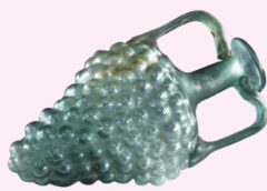
GLAZEN DRUIVENTROSFLESJE Heerlen, 100-200 n.Chr.