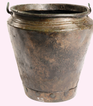
EMMER VAN BRONS Ede, 800-500 v.Chr.