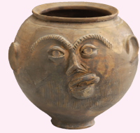
AARDEWERK DRINKBEKER MET GEZICHT Woerden, 40-80 n.Chr.