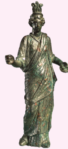
BEELDJE VAN ISIS Valkenburg, 175-250 n.Chr.